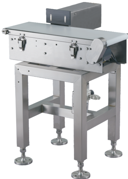
推选剔除 Push type rejector